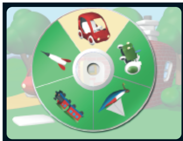
Slumpsnurren väljer automatiskt en av temats fem berättelser.