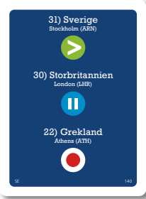
Resekort blå (används vid slutduellen)